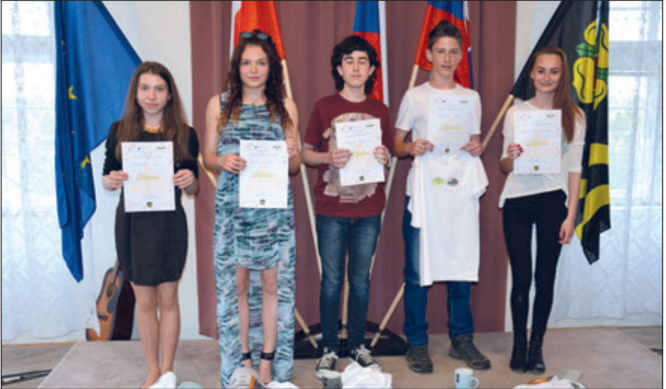
Nejlepší účastníci mezinárodní pěvecké soutěže XIXA STAR