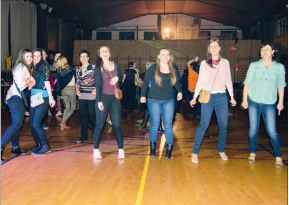
Večer pro házenou - je nám 90