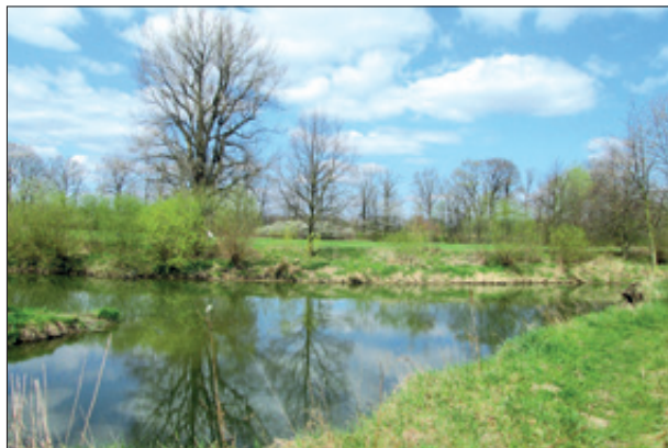
1. místo - Libuše Sýkorová

Připomeňme, že vítězka si mimo jiné odnese knihu Stará Ves nad Ondřejnicí – dějiny obce a její dominanty. Všichni umístění na 1. - 3. místě mají možnost své fotografie vystavit v rámci větší výstavy v zámecké výstavní síni. Všichni až do 5. místa obdrží propagační materiály Staré Vsi.