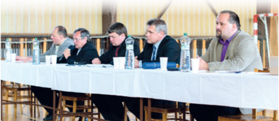
Oslavy 90 let národní házené v naší obci - valná hromada

V letošním roce, jak jsme zmínili v minulém Staroveském zpravodaji, slavíme 90 let národní házené v naší obci.