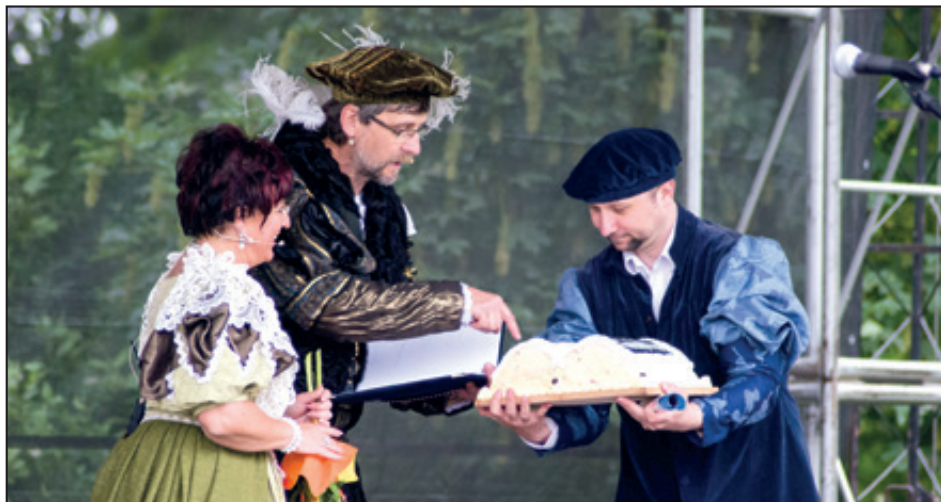
Nad dárkem od házenkářů