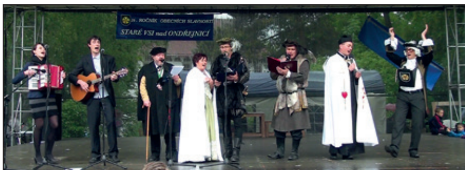
Po návratu „Jízdy“