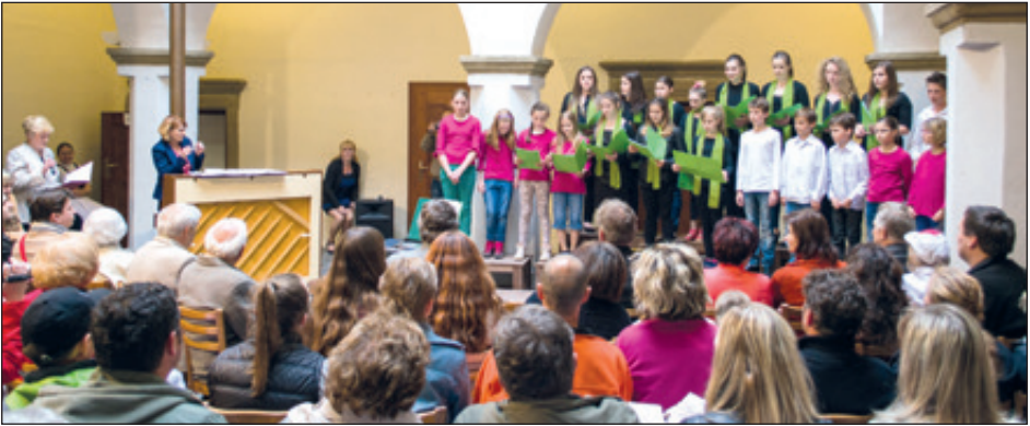
Staroveské zámecké arkády