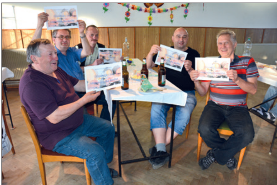
Nultý ročník koštu zahrádkářů