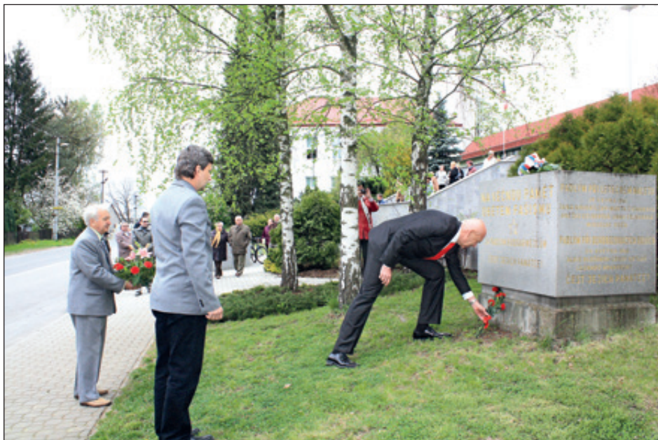
Pietní akt 70 let osvobození