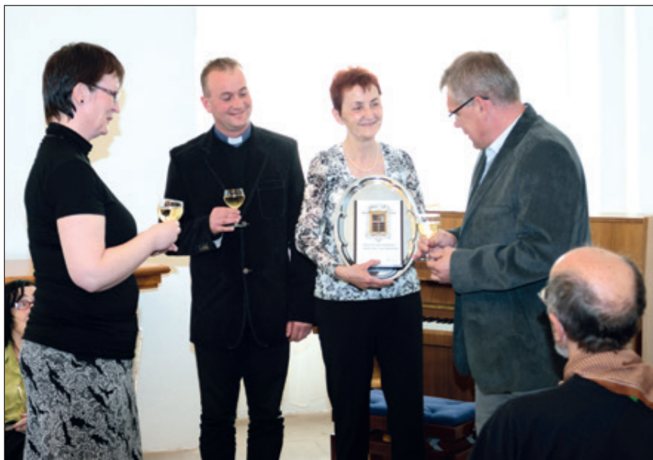
Křest knihy - Stará Ves nad Ondřejnicí - dějiny obce a její dominanty