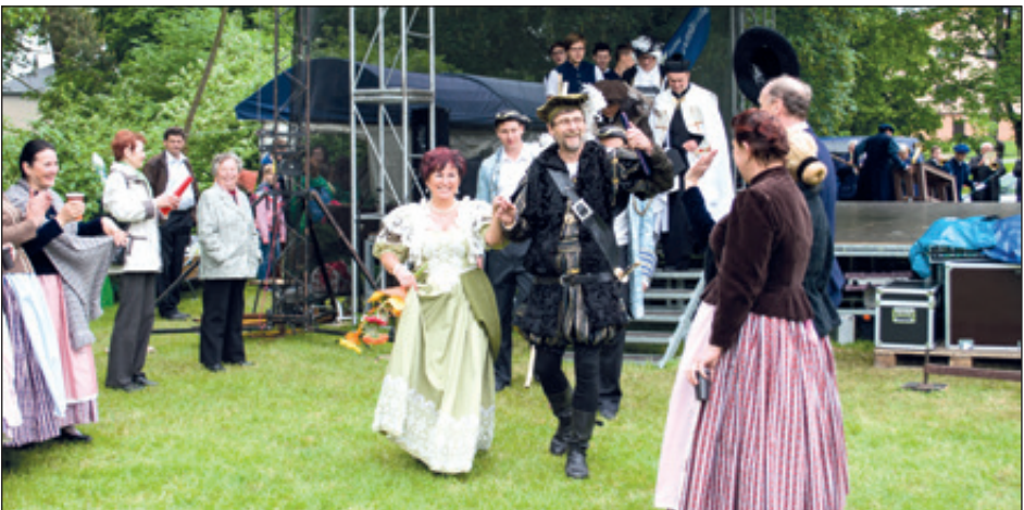
Vrchnost zdraví poddané