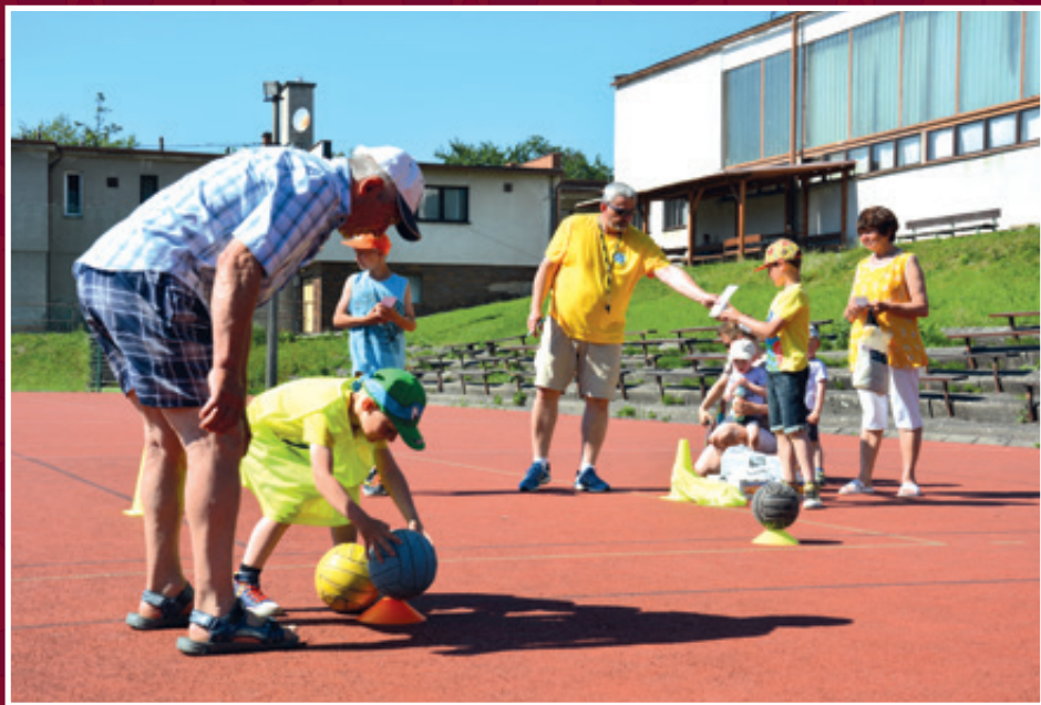
Dětský den staroveeských spolků