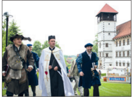
Fojt s farářem a jinochem