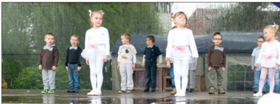
Vystoupení dětí mateřské školy