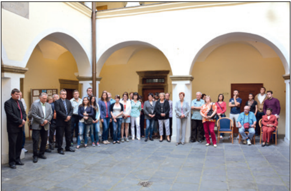
90 let národní házené v obci – zahájení oslav v zámku