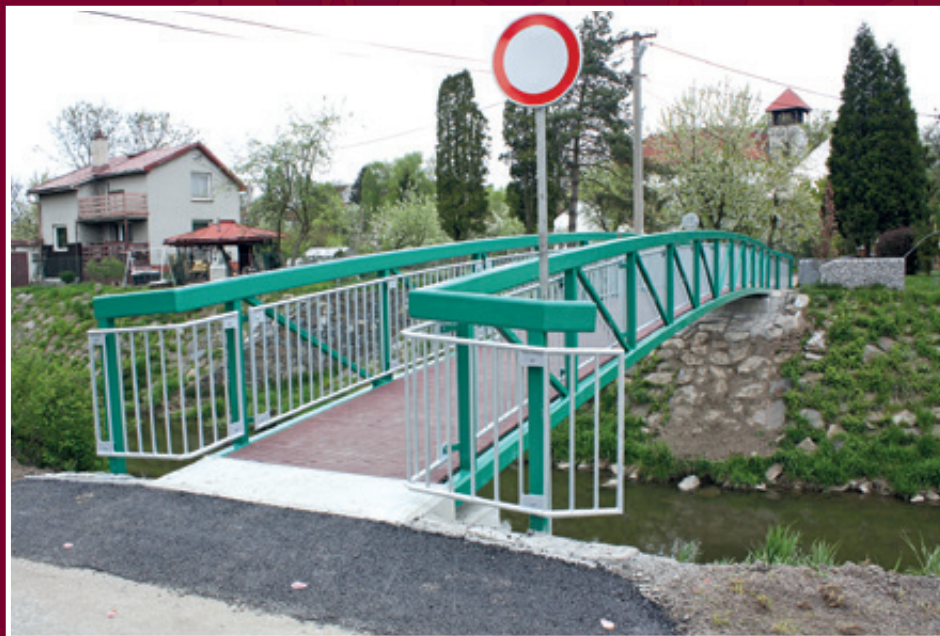
Nová lávka u Stabravú