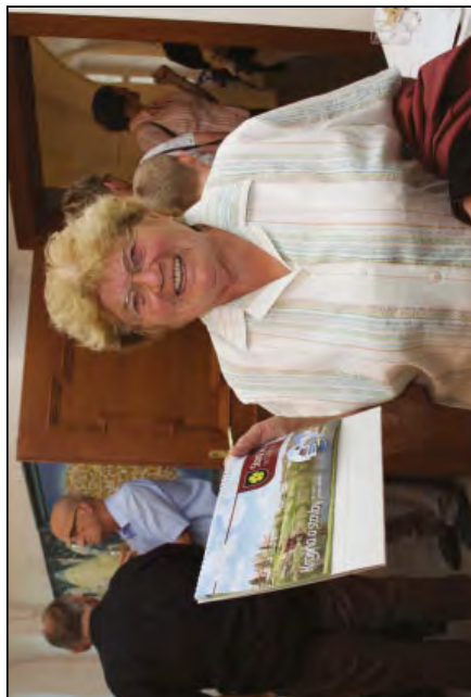
První šťastná majitelka kalendáře na rok 2016