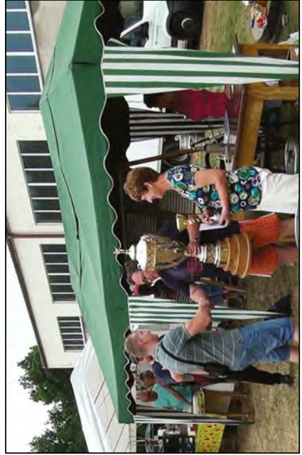
Předávání cen v hasičské soutěži O pohár starosty