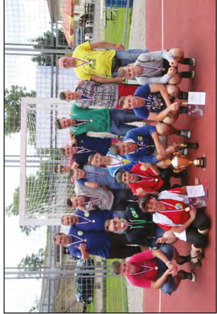
Závěrečné foto zlatých dorostenců s fanoušky