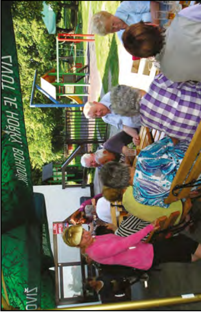
Seniři si vyjeli na kolech