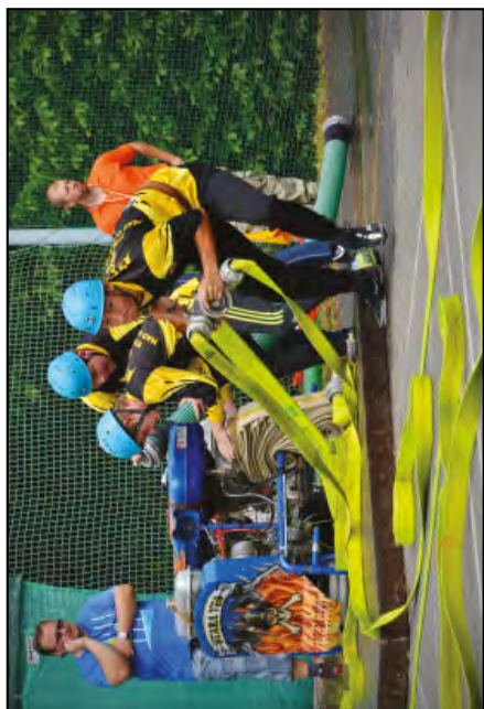
Mladé soutěžní družstvo SDH Stará Ves n. O. v akci