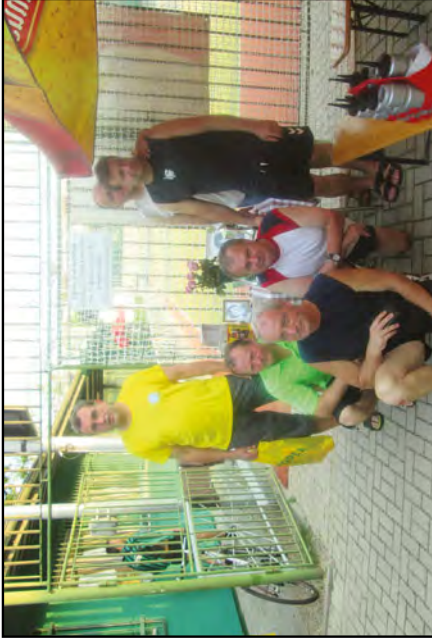
Staré gardy na turnaji v Žatci, zase nejlepší