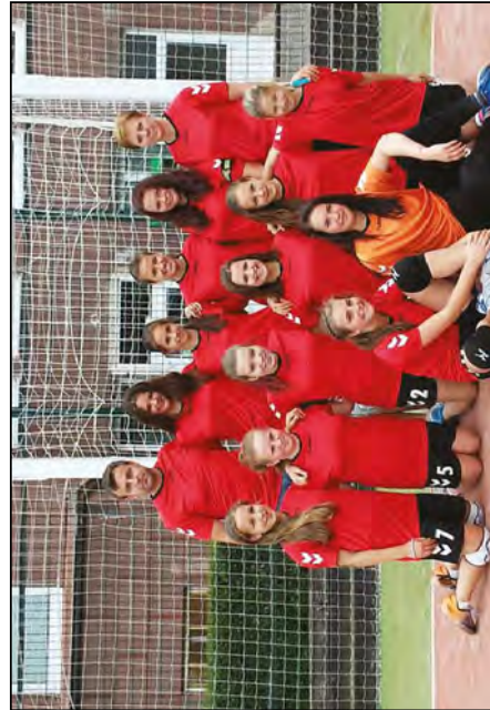
Starší žáčky na Poháru ČR v Libínově vybojovaly bronz