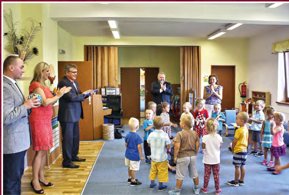
Zahájení školního roku 2015/2016 v mateřské školce