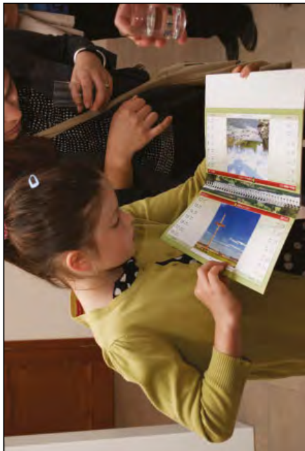
Kalendář zaujal všechny věkové kategorie