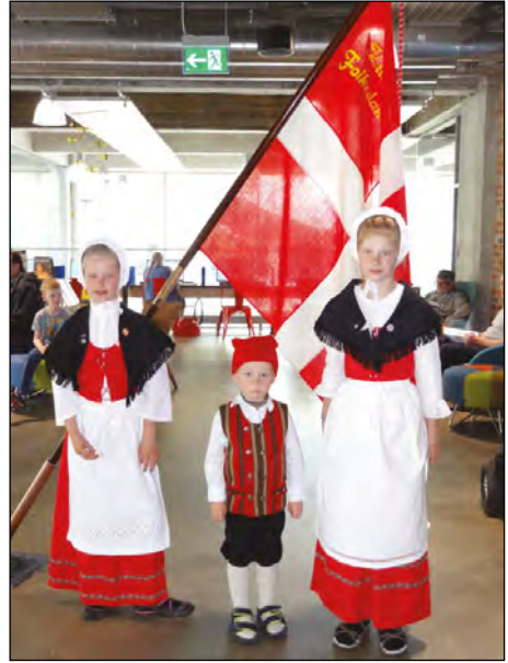
Předávání upomínkových předmětů na radnici města Herning