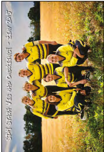
Hasičky SDH Stará Ves n. O. - Vítězky Moravskoslezské ligy v požárním útlaku