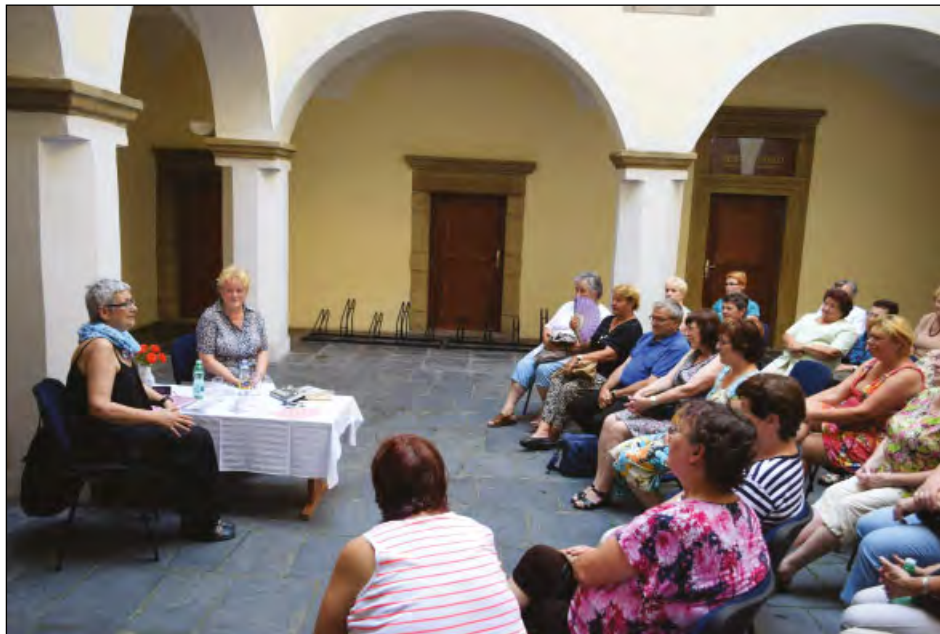
Beseda se spisovatelkou Irenou Fuchsovou