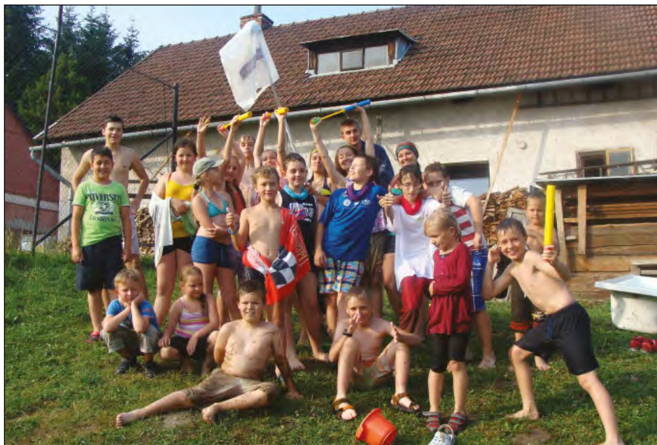
Farní tábor ve Vendryni