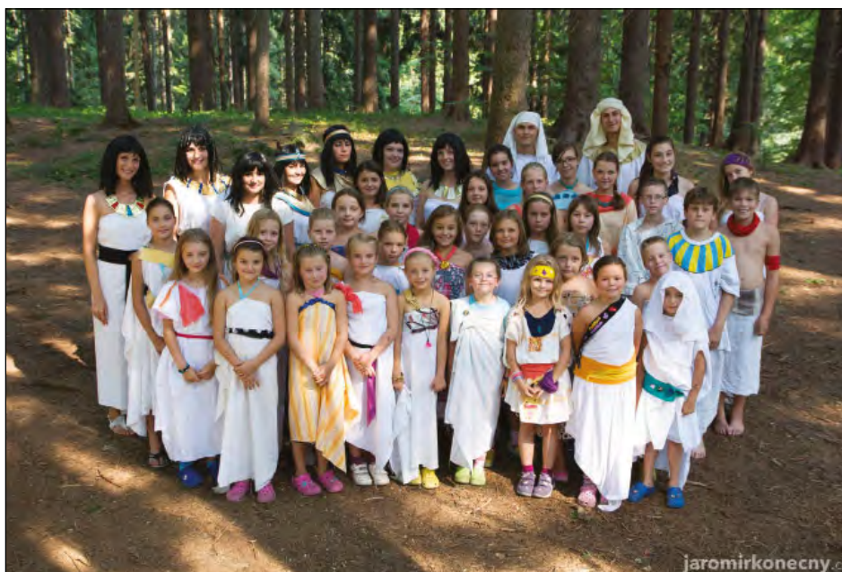
Tábor Ondřejnica - cesta časem do starověkého Egypta