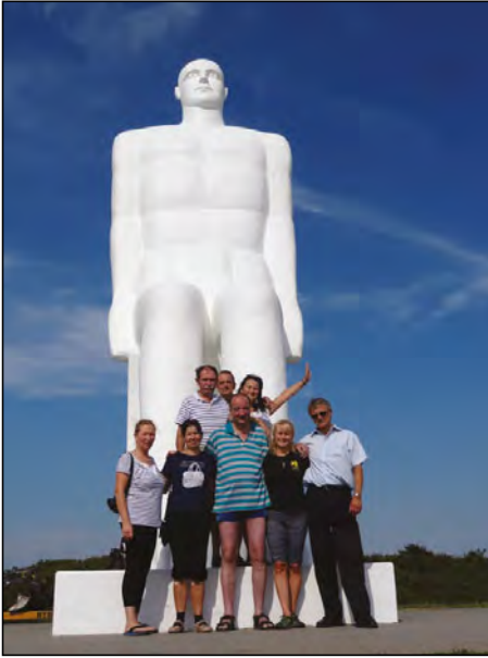
„Man Meets Sea“ devítimetroví muži z bílého betonu pomyslně vítají návštěvníky města Esbjerg