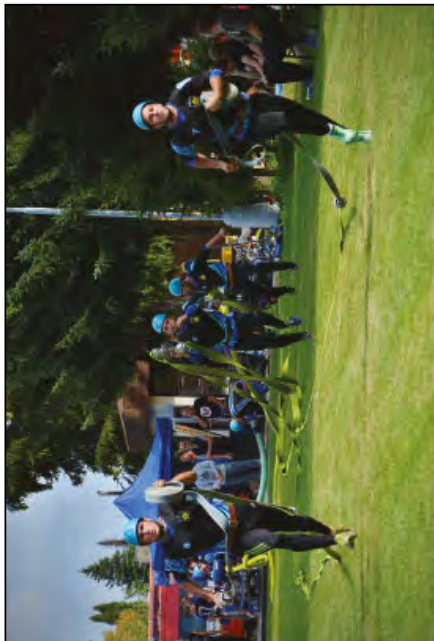
A-tým staroveských hasičů na soutěži v Bartovicích