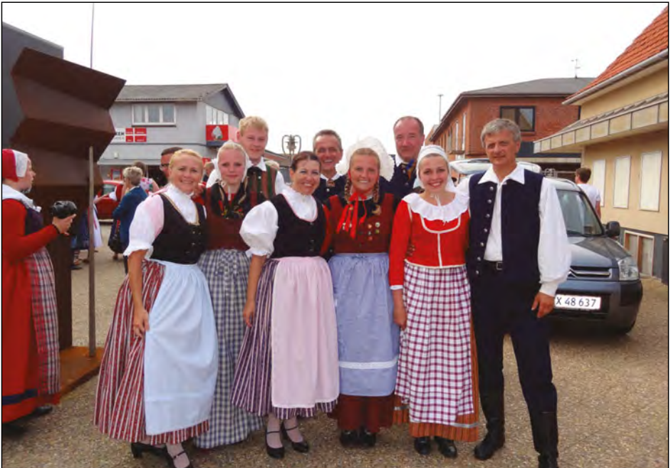
Foto s členy dánského souboru Sonder Felding