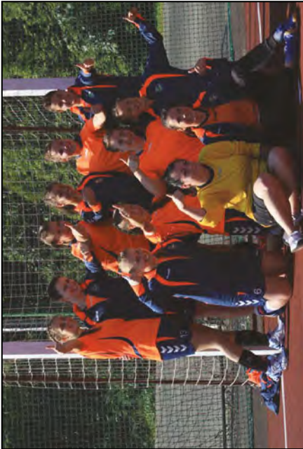
Naše dorostenky vybojovaly 3. místo na MČR ve Staré Vsi