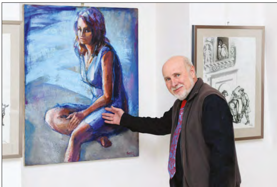
Výstava obrazů Petra Sedlíka