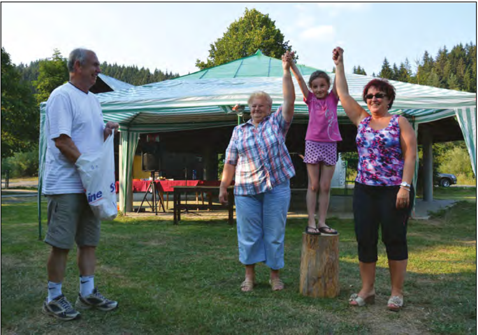
Vyhlášení vítězů soutěže při srpnové návštěvě zahrádkářů v Rakové