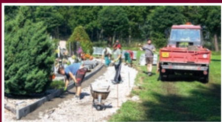
Nové chodníky v urnovém háji