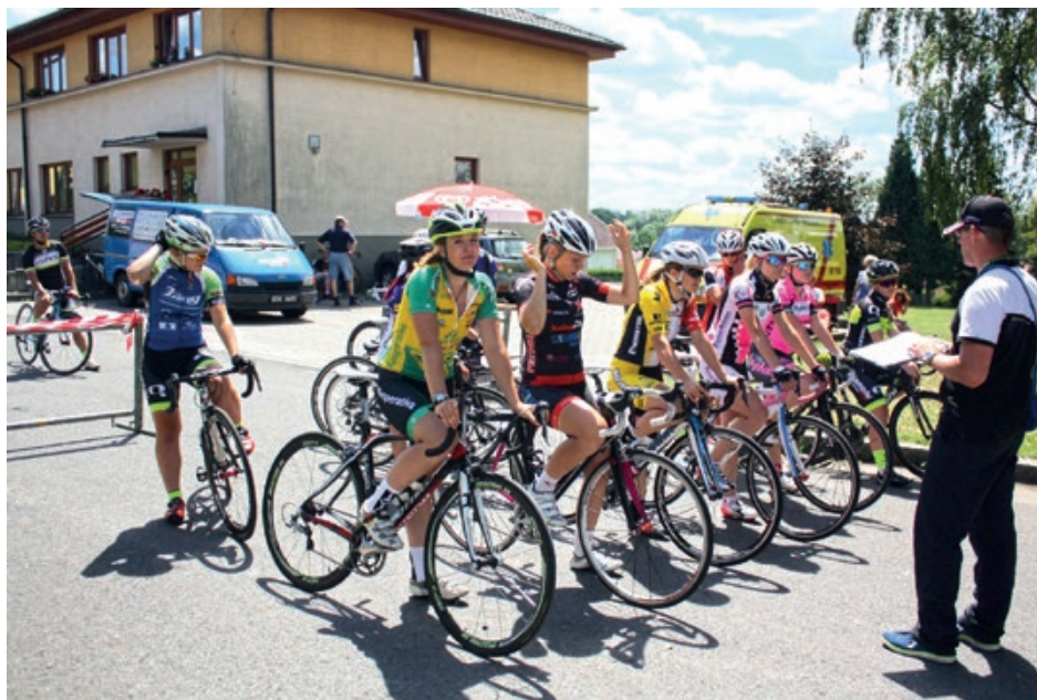
Kritérium mezi ploty