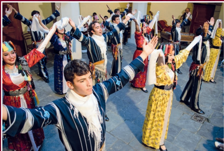
Folklorní večer na zámku - soubor z turecké Ankary