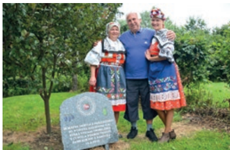
Návštěva z Rakové s krojovanými Starovačkami