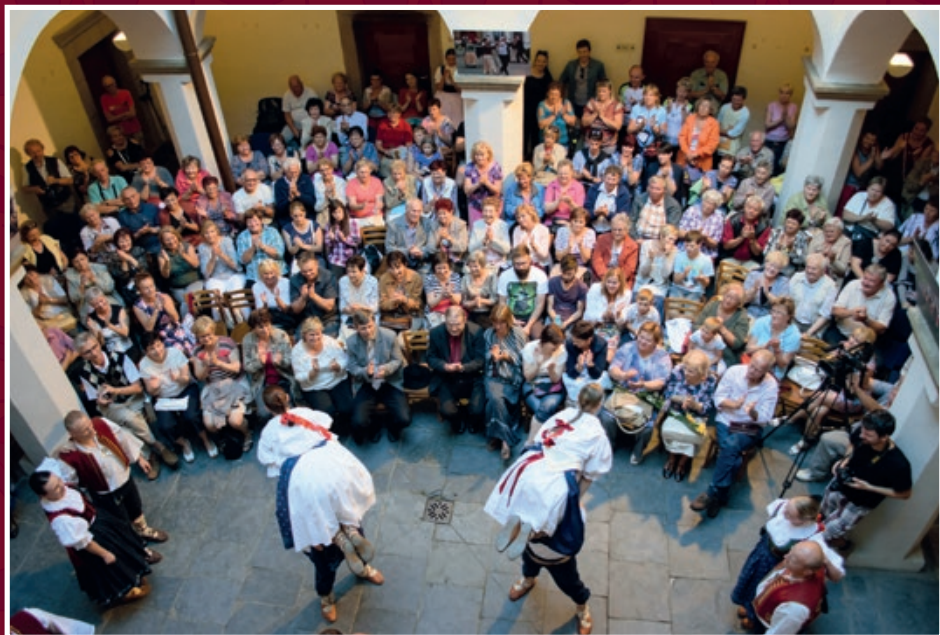
Folklorní večer na zámku - soubor Soláň z Rožnova p. R.