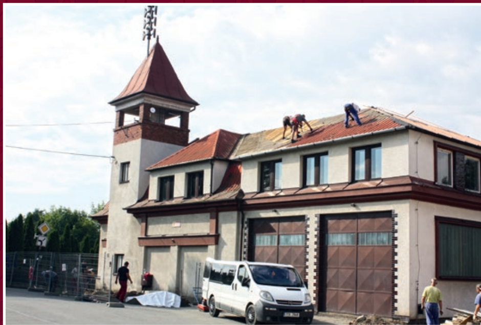
Oprava střechy hasičárny, dole pozemní úpravy