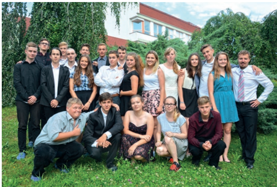
Poslední zvonění s 9.A