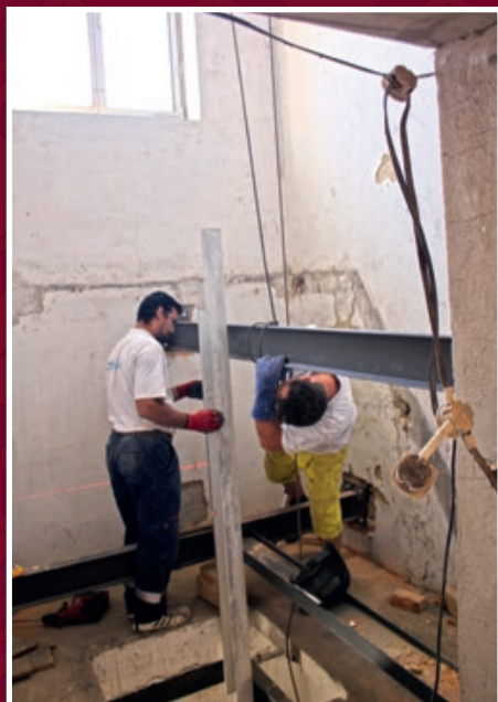
Stavba výtahové šachty uvnitř hasičárny