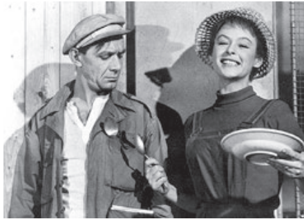
Irena Kačírková a Josef Kemr ve filmu Starců na chmelu