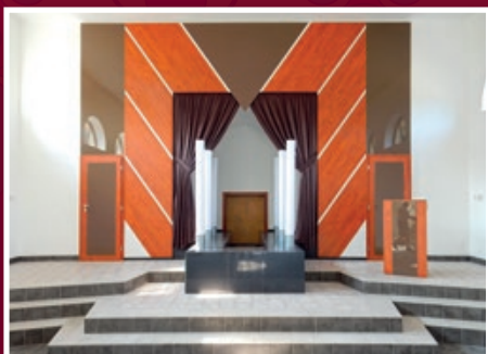
Nová podlaha a obklady interiéru ve smuteční obřadní síni