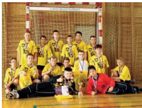
Pohár ČR mladších žáků

Také naše dorostenky na PČR v Praze uspěly a skončily, i když s troškou štěstí, na krásném 3. místě. Pro mladé hráčky by to mělo být povzbuzení do další sportovní činnosti.