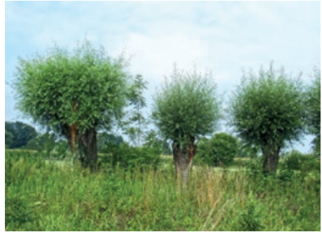
V Košatce byly vrby ořezány na podzim 2015

Hlavatky jsou nejen působivým prvkem krajiny, ale poskytují i místo k životu pro některé vzácné druhy živočichů, které jsou vázány na toto specifické prostředí – za všechny uvedme například brouka pažníka hnědého.