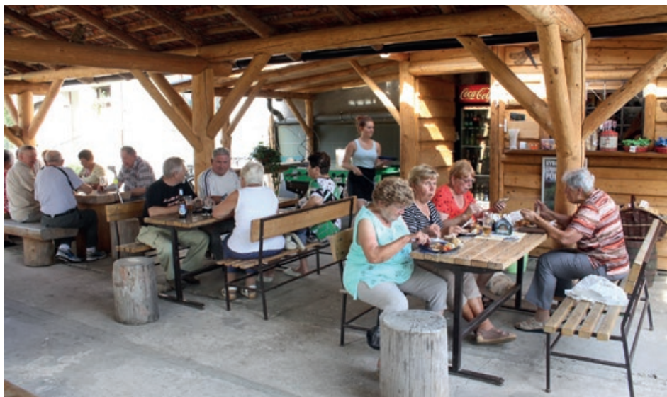
Senioři na špízu U Horního mlýna