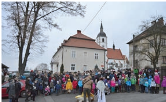
Otevírání Betléma 2017

V jednom vstupu je zajímavá aktivita, při které se žáci mají zamyslet a metodou brainstormingu (řekni, co tě napadne a zapiš na tabuli) říkat, co se jim vybaví, když se řeknou „Vánoce“. Odpovědi jsou, jak asi tušíte, velice pestré, někdy i komické (vždycky se nějaký „expert“ třídy najde ☺).