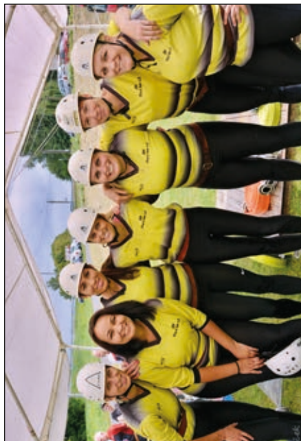
Soutěžní tým žen SDH Stará Ves n. O.