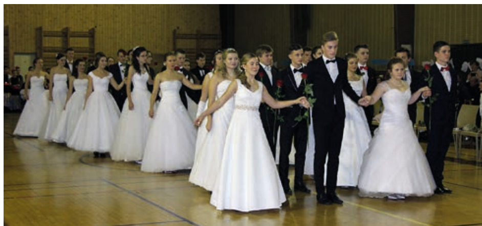
Závěrečná taneční (autor: Anna Badová FOTOS)