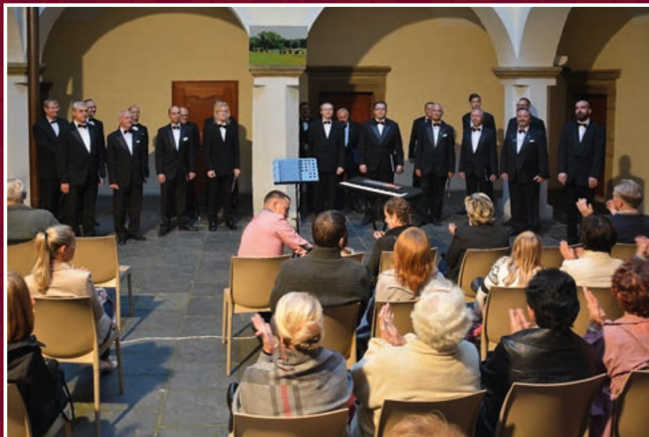
Pěvecké sdružení moravských učitelů