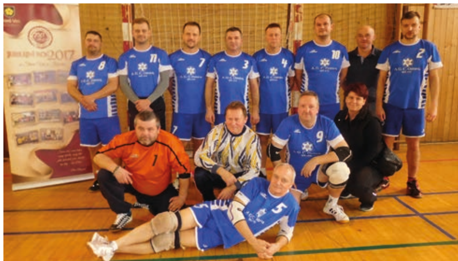
Staré gardy Staré Vsi tentokrát na druhém místě za Studénkou