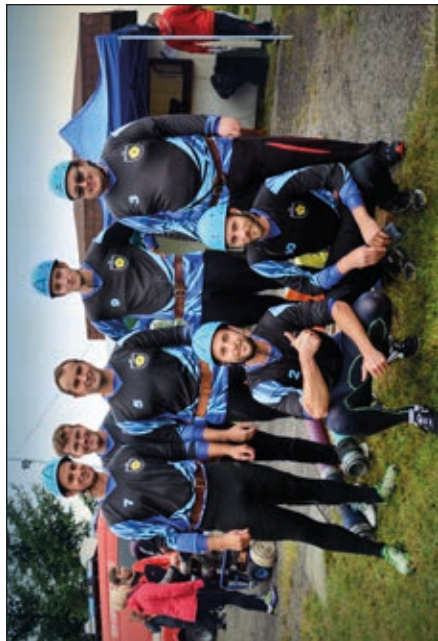
Soutěžní tým mužů SDH Stará Ves n. O.