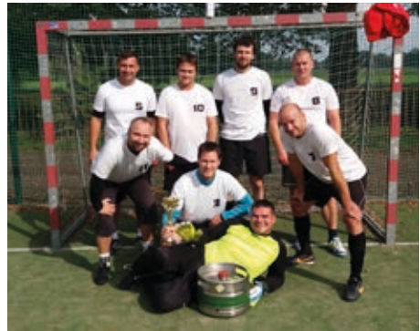
Košatecká fotbalová liga – stříbrný tým Staré Vsi n. O. Bílý úlet