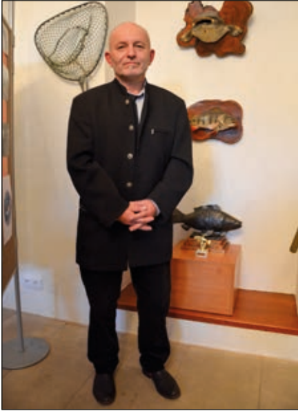
Český rybářský svaz