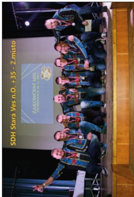
Zakončení hasičské ligy MSL – stříbrní veteráni SDH Stará Ves n. O.