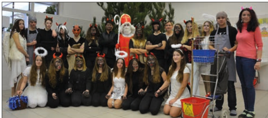
Mikuláš s čerty v ZŠ a MŠ