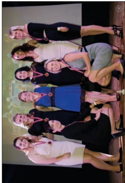
Zakončení hasičské ligy MSL – bronzové hasičky SDH Stará Ves n. O.