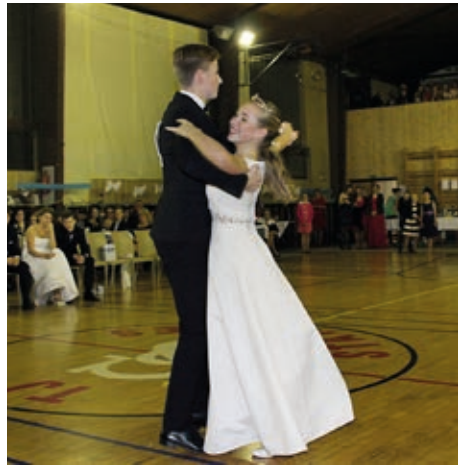
Král a královna valčíku