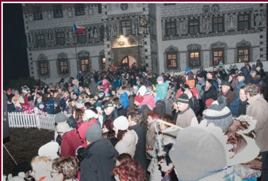
Rozsvícení vánočního stromu