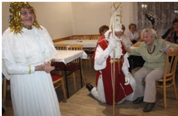
Mikuláš v Klubu důchodců

divadélka šek v hodnotě 30 tis. Kč z Nadace ČEZ na další činnost. Blahopřejeme. Poslední dva měsíce v roce se nesou ve znamení tanečních zábav. Přesně 11. listopadu, na svátek sv. Martina jsme uspořádali Martinskou zábavu. Sice bez husy, ale tradiční vepřo, knedlo, zelo bylo jako vždy vynikající. Odpoledne příjemně vystoupení seniorské taneční skupiny Beseda z Poruby. Šest tanečních párů nás pobavilo směsí tanců různých žánrů. Také přesně ve středu 6. prosince zavítal do klubu Miku-