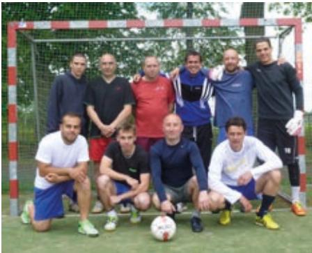
Vítězové Košatecké fotbalové ligy 2015 a 2017 – tým Ancianos