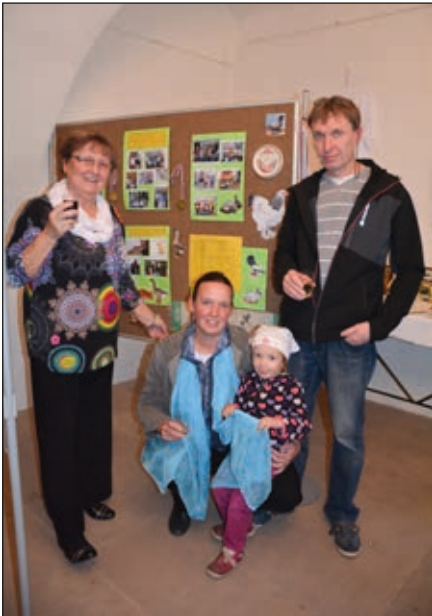
Základní organizace Českého svazu chovatelů