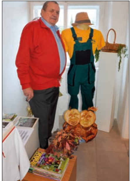
Základní organizace Českého zahrádkářského svazu